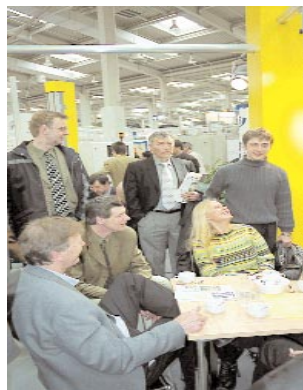
Folk fra pulverforeningen under et besøk hos Wagner, som sponset besøket på messen.

23 medlemmer i Norsk Pulverlakkteknisk Forening var med på foreningens studietur til Hannovermessen. Reisen gikk med fly til Hamburg og buss til byen Celle, der deltakerne bodde under oppholdet.